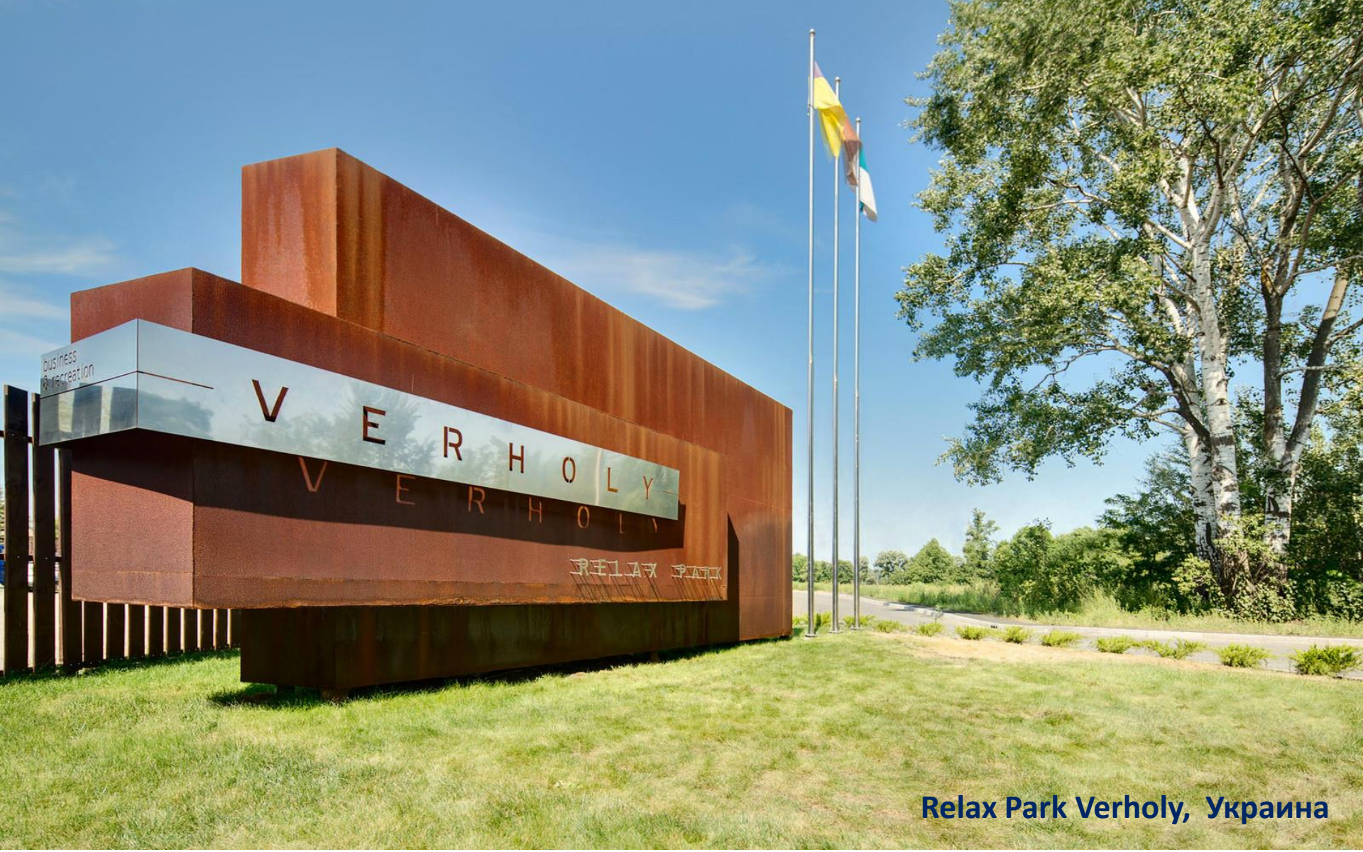
Relax Park Verholy, Украина