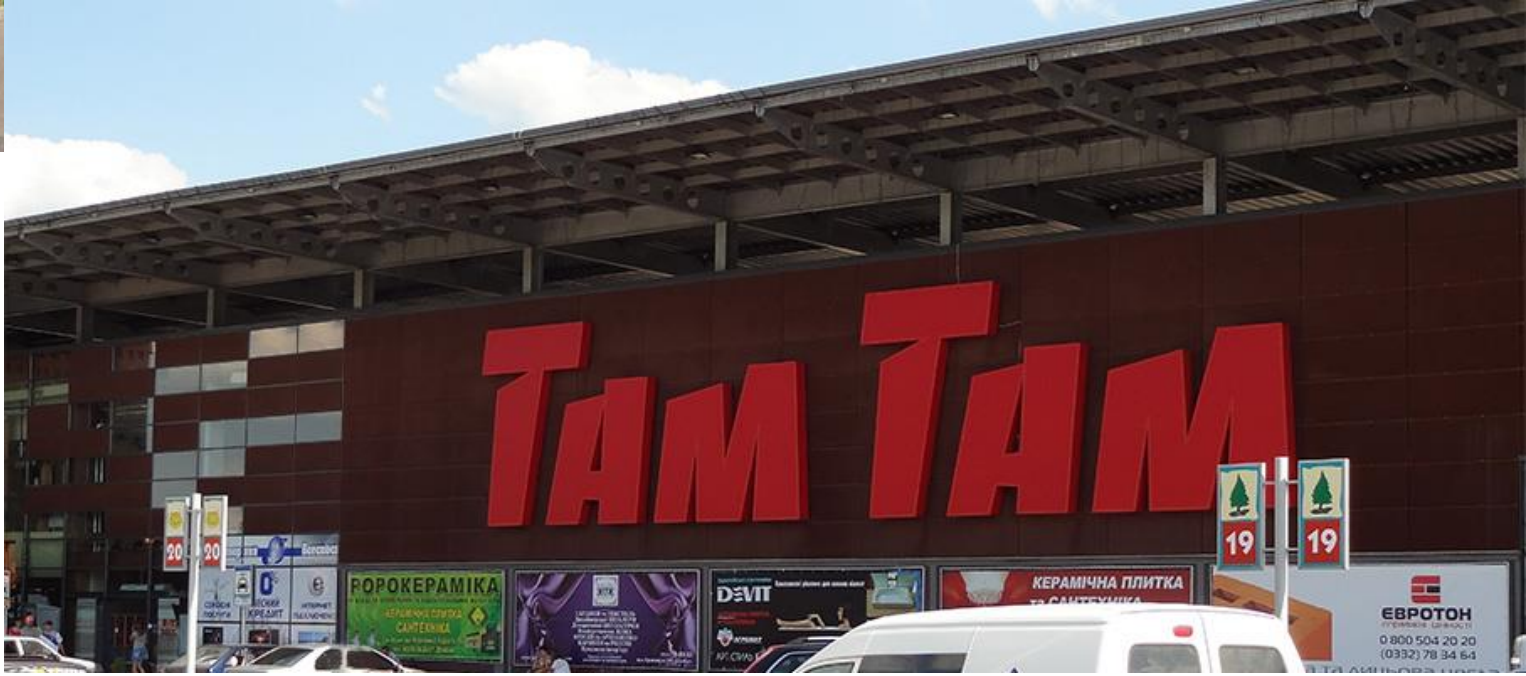
«Там Там» Украина