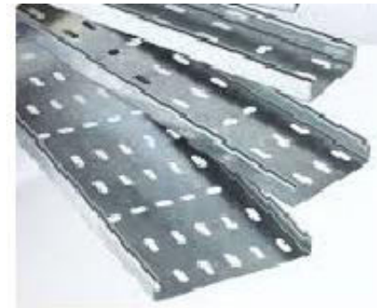
No CPR hENs