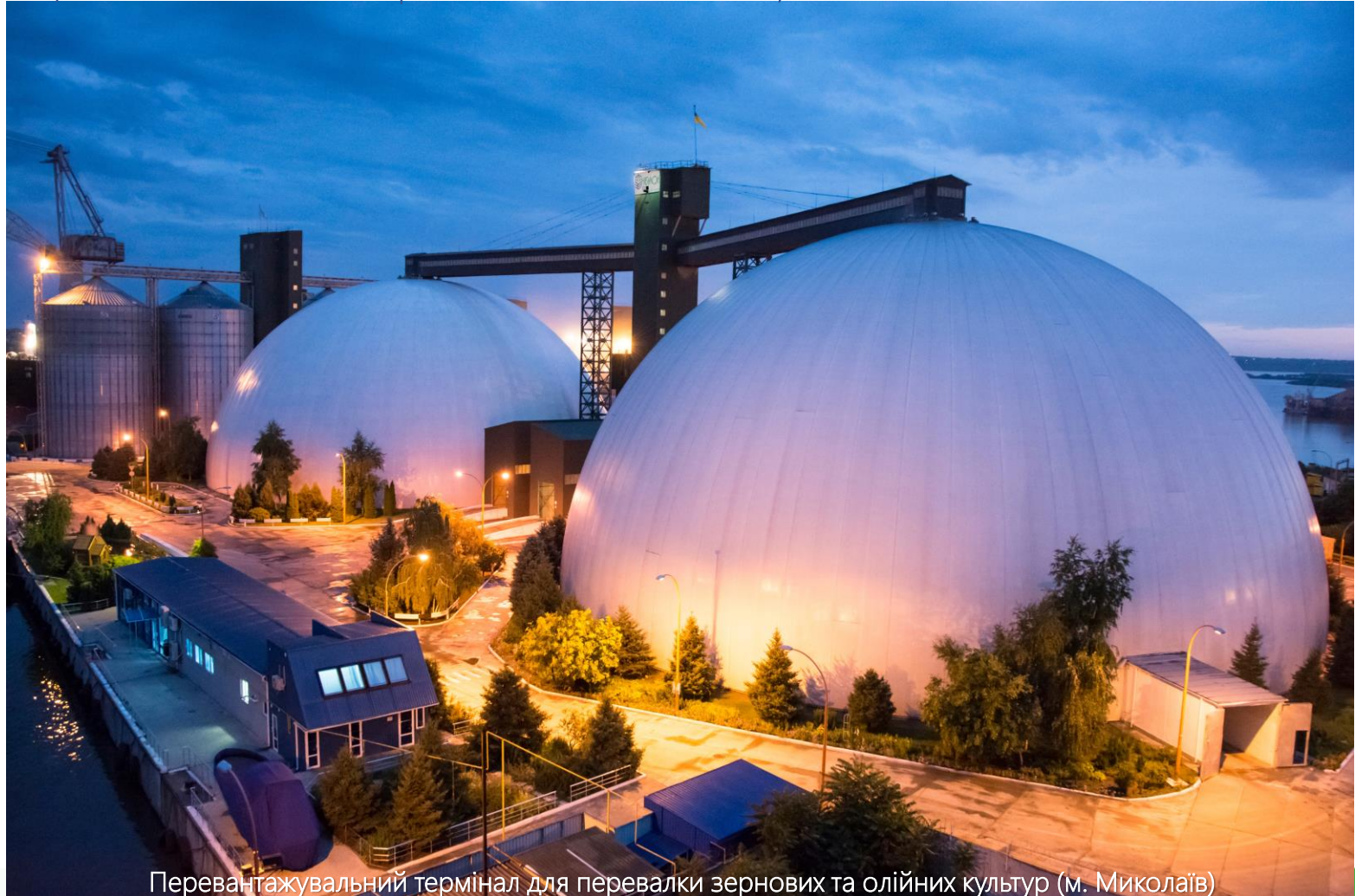
Перевантажувальний термінал для перевалки зернових та олійних культур (м. Миколаїв)

У 2016/17 МАРКЕТИНГОВОМУ РОЦІ КОМПАНІЯ ЕКСПОРТУВАЛА 4,65 МЛН ТОНН ЗЕРНОВИХ ТА ОЛІЙНИХ КУЛЬТУР